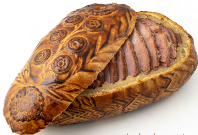
Jambon de porcelet en croûte prétranché